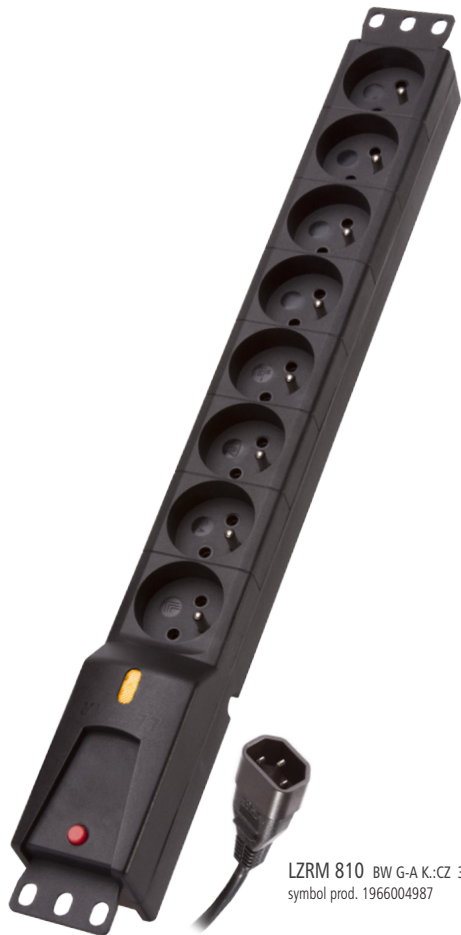
LZRM 810 BW G-A K.:CZ 3,0M IEC320 symbol prod. 1966004987