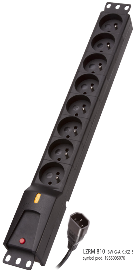
LZRM 810 BW G-A K.:CZ 5,0M IEC320 symbol prod. 1966005076