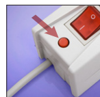
resetowalny bezpiecznik 10A