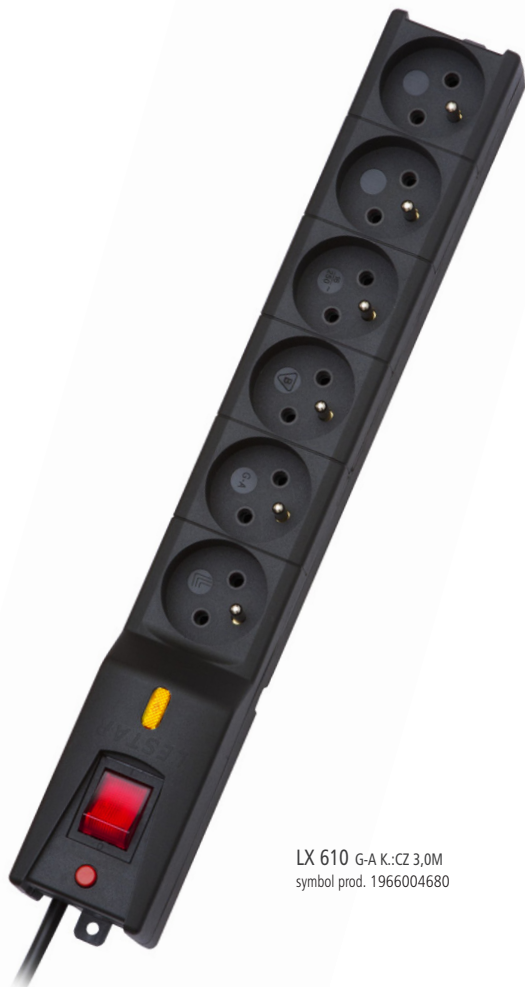
LX 610 G-A K.:CZ 3,0M symbol prod. 1966004680