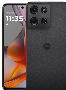
moto g75 5G Business Edition